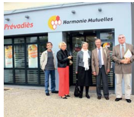
JACQUES LE MEUNAIRE

Implantée dans le centre-ville de Ploërmel, à proximité des commerces, des services et des lieux de stationnement, cette nouvelle agence accueille le public depuis le mois d'août. Elle est située dans le même immeuble que le magasin d'optique mutualiste. Son inauguration, le 20 octobre dernier, a été l'occasion de souligner l'importance de la présence de la mutuelle sur le département pour les adhérents individuels et collectifs, pour les délégués, et plus généralement pour nos partenaires. Ouvert du lundi au vendredi de 9 h à 12 h 15 et de 13 h 30 à 18 h au 12, place de la Mairie 56800 Ploërmel. Tél. : 0980 98 98 98.